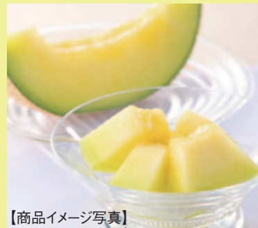
【商品イメージ写真】

旬な食材や各地のおいしいものをお選びいただける 「グルメ専用のカタログギフト」 (商品内容は変更になる場合があります)